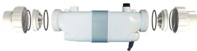
Cellule X-Cell complète avec raccordement standard Complete X-Cell with standard connection