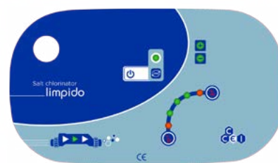
Interface d'utilisation simple Easy using interface